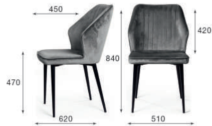
Стул обеденный Berg