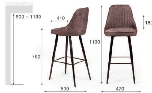
Стул барный Berg