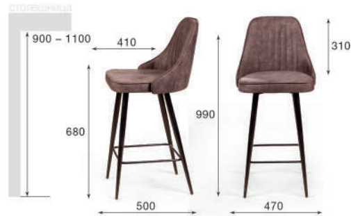
Стул полубарный Berg